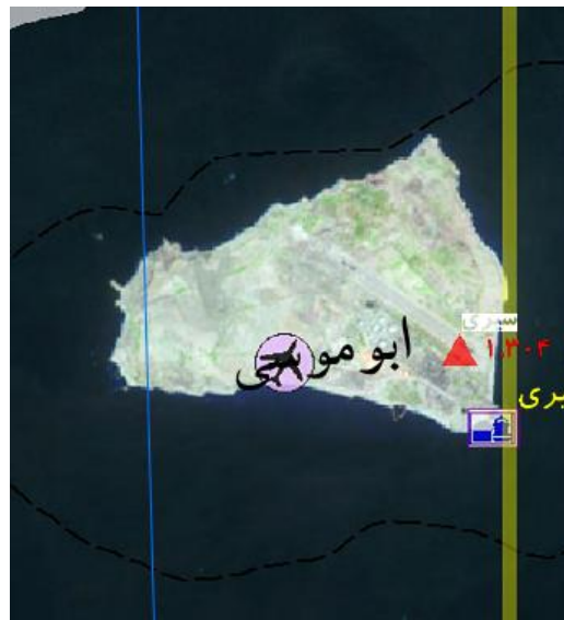
نقشه جزیره سیری - شهرستان ابوموسی